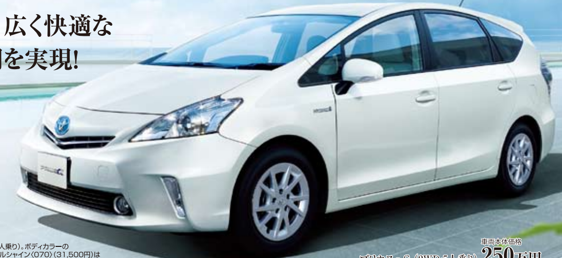
Photo: プリウス α (5人乗り)。ボディカラーはホワイトパールクリスタルシャイン (070) (31,500円) はメーカーオプションで車両本体価格には含まれておりません。