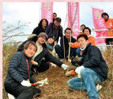
※掲載写真は全てボランティアの方々による植樹の風景になります。